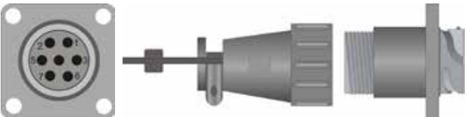
Abbildung des Anschlussteckers in der Traktorkabine.

Das Team erstellte eine internationale AEF-Richtlinie, die von ersten Landtechnik-Herstellern bereits umgesetzt ist. So können Anwender ohne Rücksicht auf Lieferant oder Marke Kameras mit ISOBUS-Terminals oder anderen Monitoren verbinden, was ihnen größere Flexibilität bei der Auswahl und beliebige Kombinationen von Traktoren und Anbaugeräten bietet. Die Vereinfachung wird auch dazu führen, dass mehr Kamerasysteme eingesetzt werden. Dies wiederum wird die Sicherheit auf und um Traktoren und Geräte herum erhöhen und damit die Unfallhäufigkeit beim Umgang mit Landtechnik verringern.